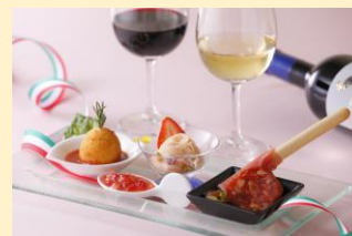
『アンティパスト』 お食事の前にどうぞ…