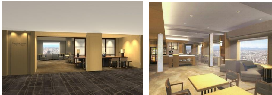
画像左：エントランス完成イメージ パース図 右：内観イメージ パース図

セルリアンタワー東急ホテル(東京都渋谷区、総支配人：宮島芳明)では「エグゼクティブフロア」にご宿泊の方のための専用サロン「エグゼクティブサロン」の改装工事を行い、2018年4月1日(日)より名称も新たに「エグゼクティブラウンジ」としてサービスを開始いたします。サービス内容も一新しよりグレードの高いおもてなしを提供してまいります。