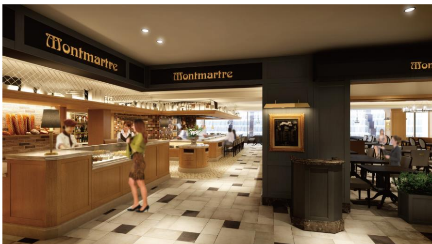
パリの石畳をイメージし、明るく開放的な店内に。セルフピックアップのペーカリーコーナーも新設。