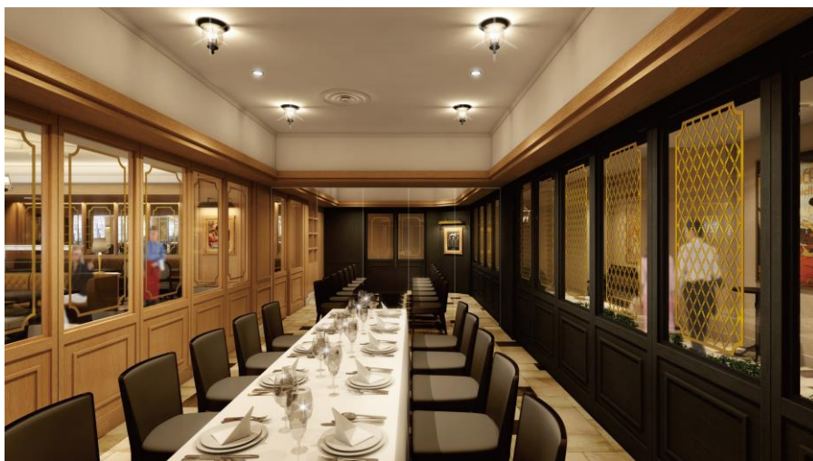
最大30名までのプライベートルームを新設。ランチタイムにはカルチャー教室の開催や、ディナータイムは季節の会合等に対応します。

漂う香りや音、立ち上がる炎など、活気溢れる演出が魅力の“ライブキッチン”を新設し、目の前で調理するシェフのパフォーマンスと熱々・出来たての料理をお楽しみいただけます。また、午後のティータイムには“スイーツ&デリカbuffet”が新登場。朝食からディナーまでいつ来てもワクワクする、食べて美味しい！見て楽しい！五感の全てを刺激するオールデイダイニング「モンマルトル」が誕生します。