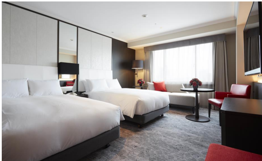
ツインルーム。心はずむカラーのフレンチレッドをアクセントにモダンな客室が誕生します。