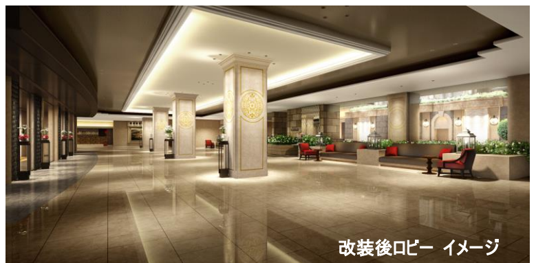
改装後ロビー イメージ

所在地：愛知県名古屋市中区栄 4-6-8 TEL 052-251-2411(代表) 開業日：1987年8月20日 客室：564室 レストラン：6 レストラン・バー（テナント2店舗含む） 宴会場：15室 施設：結婚式場・写真室・美容室・衣裳室 エステティックサロン・フィットネスクラブ ショッピングアーケード