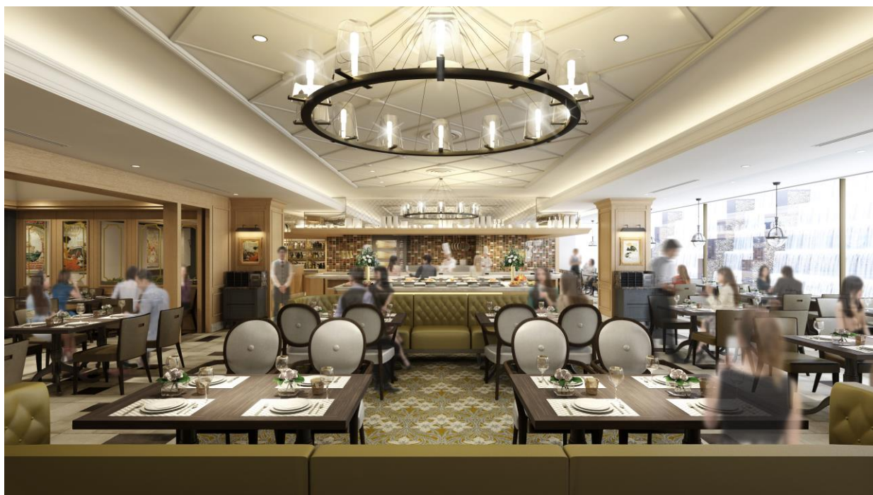
中央にbuffet台とライブキッチンが登場。お料理の香りや温度感がダイレクトに楽しめます。