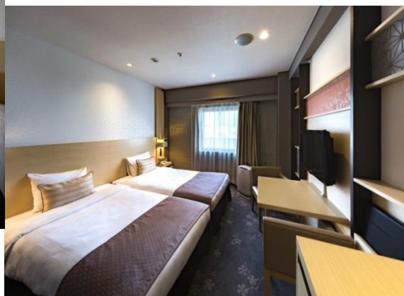
スーペリア ツインルーム 18.4㎡

フロントカウンターを名古屋城下町の基盤割をイメージした化粧格子で囲い、天井からカウンターに伸びる照明には瀬戸組子が嵌め込まれております。フロントカウンター後方には「名古屋 手描友禅」、「伊勢型紙」、「有松絞」、「名古屋友禅 型染」といった名古屋ゆかりの伝統工芸のアートワークパネルをディスプレイし、スタッフとともにお客さまのお迎え、お見送りをいたします。ロビーに設置された間接照明化粧柱の「金」と、愛知県産の竹の「緑」で「竹林豹虎図」を体現。チェックイン・チェックアウト前後のお待合時間にも和の文化が楽しめる空間となっております。