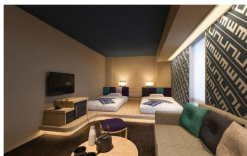
コンセプトデラックスツイン