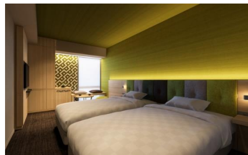
コンセプトツイン