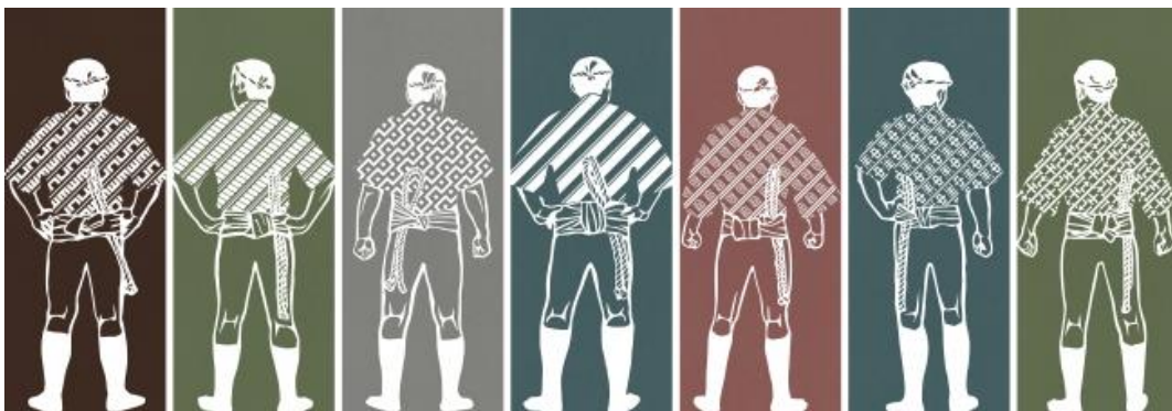
客室扉デザイン：左から恵比須流・大黒流・土居流・東流・西流・中洲流・千代流

コンセプトフロア「博多山笠」は、訪日外国人旅行者にホテルでも「博多」を感じてもらいたく誕生しました。デザインモチーフは、博多祇園山笠で着用する水法被の柄です。この柄は、博多の自治組織の呼称「流（ながれ）※」ごとに異なります。7つの「流」のモチーフを客室階エレベーターホールの壁面にあしらい、博多祇園山笠の賑わいを表現しました。客室扉には水法被を纏った締め込み姿の男性のイラストが描かれ、祭りの雰囲気を感じることができます。客室内は日本文化を体験できるよう、座布団を置いたベンチシート、水法被柄の作務衣タイプのルームウェアを用意。また室内は履物を脱ぎ、鼻緒スリッパで過ごしていただきます。