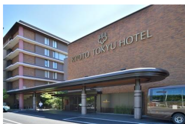
京都東急ホテル外観

「夢みる旅行記～ホテルの宿泊券をプレゼント」 https://www.comforts.jp/travel/1435/