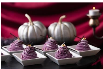
紫イモのモンブラン