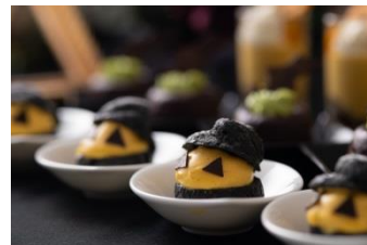
竹炭のシュークリーム