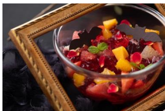
ローズヒップジュレ