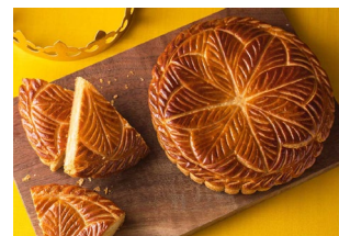
ガレット・デ・ロワ イメージ