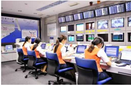
国内線インフォメーションセンター

羽田空港国内線のインフォメーションセンターや日本初の空港内美術館をご案内していただけるほか、羽田空港限定のスイーツ、スタッフおすすめの撮影スポットについても教えていただきます。