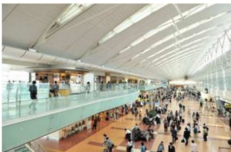
国内線第2旅客ターミナル