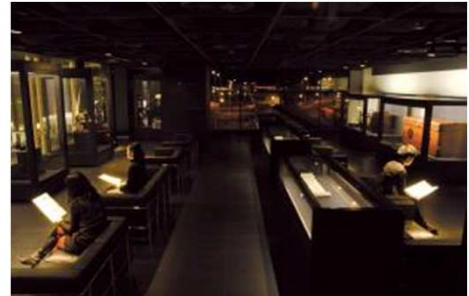
空港内美術館(イメージ)