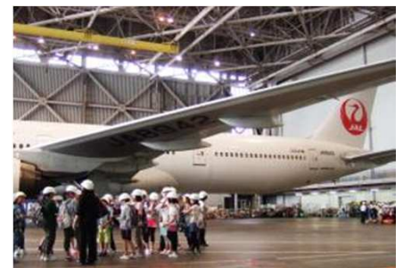
機体整備工場風景