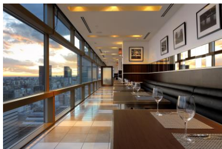
黄昏時のソファ席

恵比須側を向いており、座席数は2名用の席が8テーブル、計16名分となりました。夜はア・ラ・カルト料理とワイン、カクテルなどを提供するワインバーのような空間とし、渋谷の街の喧騒を忘れてカップルやおひとり様の女性がお酒を楽しめる希少な空間を目指しました。