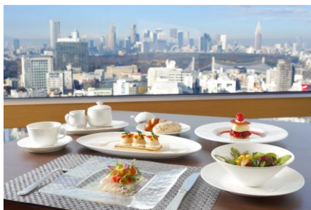
ランチイメージ(新宿側)

「ア ビエント」には大きく分けてエリアが二つあります。一つはメインダイニングのエリアです。2 名席、4 名席など通常のテーブル席とソファ席があり、このエリアでは朝食は洋食ビュッフェを、ランチ・ディナーでは主にコース料理を提供しております。眺望としては代々木公園から目の高さで新宿副都心まで見渡すことができる新宿側と、恵比寿方面、遠くに横浜みなとみらいのビル群まで見える側があり、朝の空気の澄んだ時間から煌めく夜景まで、それぞれの時間帯で景色をお楽しみいただけます。今回の改装では照明もリニューアルし、照度を全般的に落として夜景がこれまでよりもっと美しく見えるようになりました。落ち着いた雰囲気の中でシェフ自慢の料理に会話もはずむことでしょう。