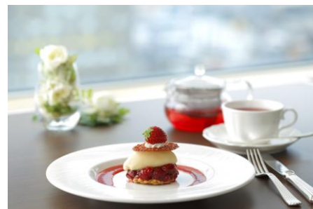
ティータイムのデザートセット

また、ランチタイムとディナータイムの間、これまでは店をクローズしておりましたが、このたび、この空間を生かしてティータイム営業を始めました。提供するメニューはデザート5種類とコーヒー、紅茶、ハーブティーなどの飲物となっております。渋谷の街でゆっくりお茶を飲めるスペースとして、しかも地上100メートルの景色を眺めながら…という贅沢な空間を提供できるようになったことが今回のリニューアルの大きなトピックスと言えます。