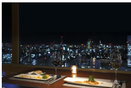
ワインバーイメージ