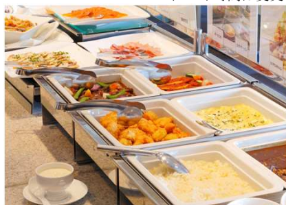
新春ランチbuffetイメージ

※イベントは無料でご参加いただけます。(ご宿泊、レストランご利用のお客様に限りです) イベント時間は変更になる場合がございます。