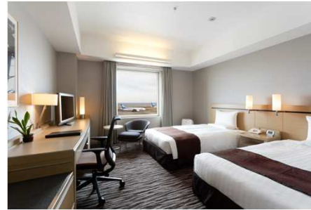
プレミアムツインルーム(滑走路側)