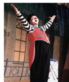
バルーンアートショー(1日・2日)

期間:2015年1月1日(木・祝)～4日(日) 時間:(1)1月1日～3日(2部制) 第1部11:30～13:00 第2部13:30～15:00 (2)1月4日 11:00～14:30 料金:大人3,500円・シニア(60歳以上)3,000円・小学生2,000円・幼児1,000円 内容:ローストビーフやチーズ桶で仕上げるパスタ、デザートなど約30種類 催し物:1月1日～2日は、クラウンブッチャーによるバルーンアートショーを開催します。