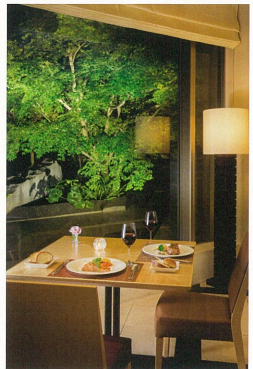
※料理写真はイメージとなります。

「クリスマスディナーコース」はメインダイニング「クーカーニョ」（40F）にてご用意いたします。混雑するクリスマス当日を避けて、早めの時期にごゆっくりとお食事を楽しみ頂きながらクリスマスのひとときをお過ごしいただけます。シェフがこの季節におすすめの食材を用いて、ひと皿ひと皿に織り成すプロヴァンス料理をぜひお楽しみください。