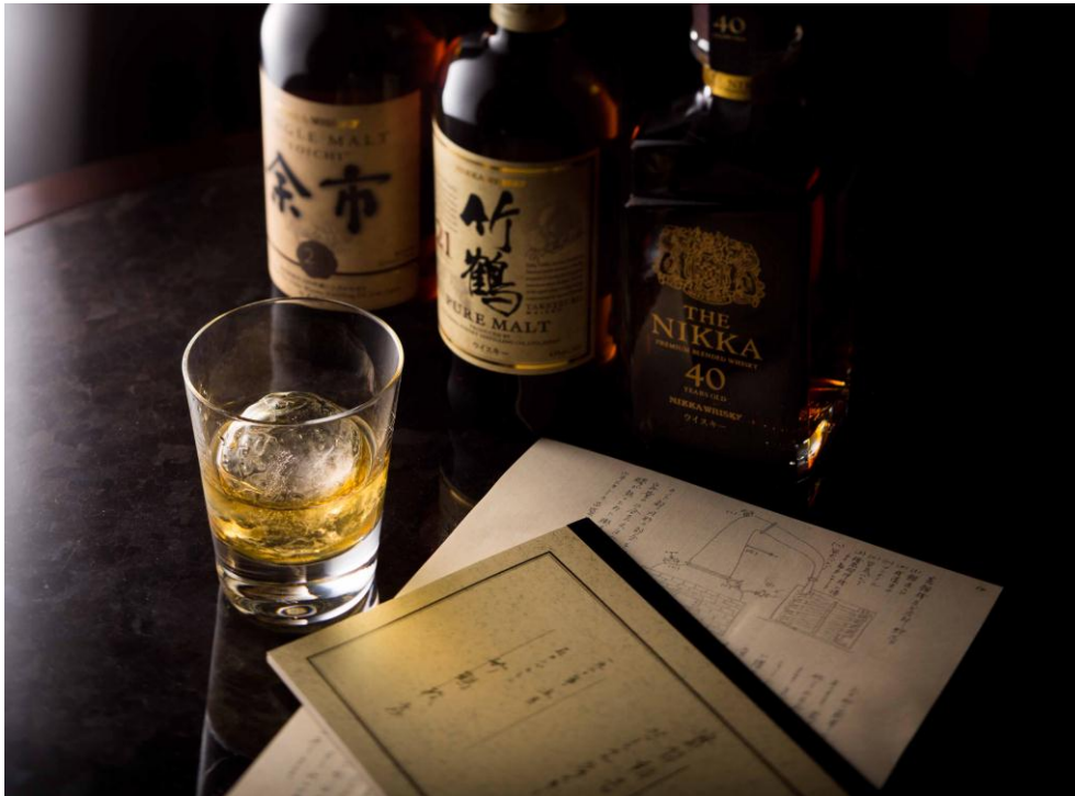
「竹鶴」「余市」と竹鶴政孝が残したノート（レプリカ）＊画像はイメージです

ザ・キャピトルホテル 東急（千代田区永田町 総支配人：但馬 英俊）では、2015年1月1日（火）から3月31日（火）まで、4F「ザ・キャピトル バー」にて「竹鶴・余市フェア」を開催いたします。