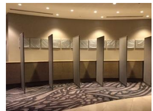
クロークでのパテーション設置

※上記スタイルは2020年6月17日時点によるものとし、以降の状況の変動により緩和の可能性もございます。 ※写真はイメージです。