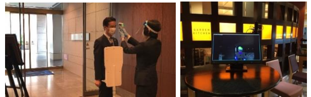
入館時の消毒と検温の徹底