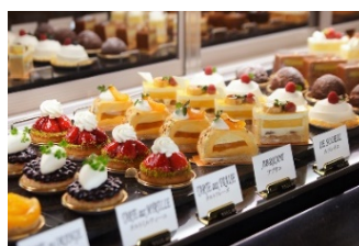
ペストリーコーナー イメージ

◇横浜ベイホテル東急では、お客さまの安全と健康を第一に、新型コロナウイルス感染防止対策に最善を尽くし取り組んでまいります。詳細はホテル公式ホームページをご覧ください。 https://ybht.co.jp