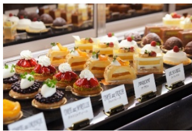
ペストリーコーナー イメージ

◇横浜ベイホテル東急では、お客さまの安全と健康を第一に、新型コロナウイルス感染防止対策に最善を尽くし取り組んでまいります。詳細はホテル公式ホームページをご覧ください。 https://ybht.co.jp