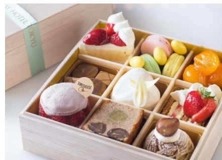
「ホワイトデー ジュエルボックス」イメージ