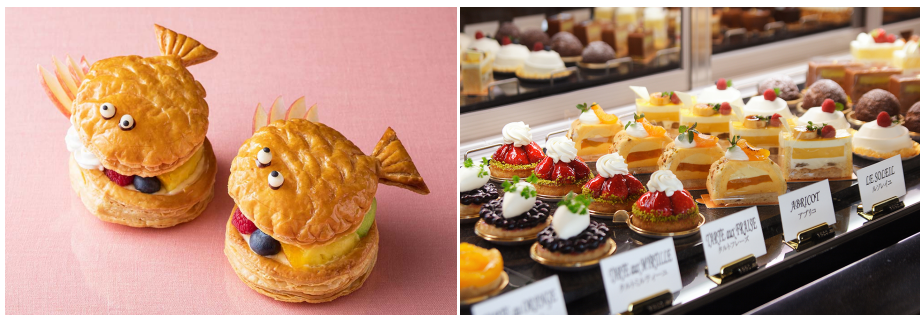
※「ポワソン ダブルル」イメージ(写真左)、ペストリーコーナー イメージ(写真右)