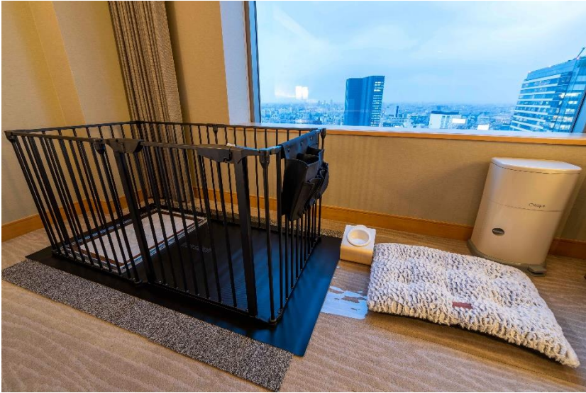
専用アメニティー設置イメージ

・スタイリッシュドッグサークル&シート・ストレージバッグ、トイレトレイ（free stitch 製品）