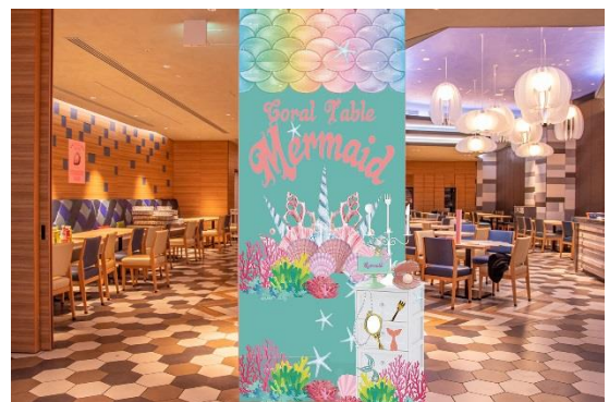
コーラル テーブルフォトスポットイメージ