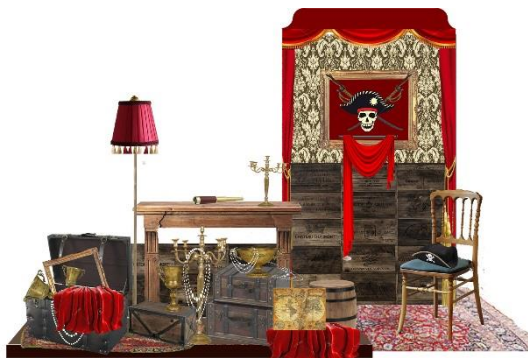
宴会場フォトスポットイメージ