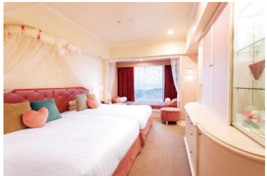
プリンセスルーム