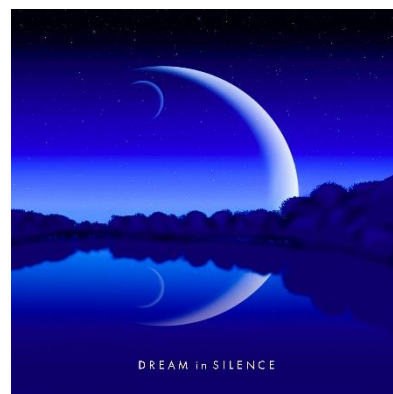
Dream in Silence ジャケット写真