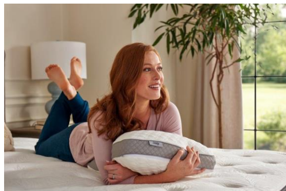
Sealy ピロー・マットレス イメージ

[期間] 2021 年 10 月 27 日 (水) ~2022 年 10 月 31 日 (月)