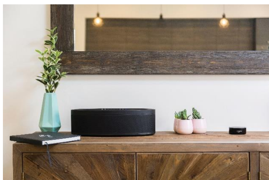
ヤマハスピーカー イメージ

各製品を実際に「眠りながら」試せるため、買い替えをご検討の方にもおすすめのプランです。