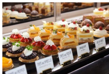
ペストリーコーナー