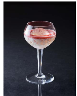
シグネチャーカクテル “パールボール”

さらに相談会を終えた後はバーにて、大切な一步を踏み出したお二人へホテルから記念のカクテルをプレゼントいたします。特典のシグネチャーカクテル“パールボール”は、かつて旧キャピトル東急ホテル時代に数々の新郎新婦の披露宴を執り行ったボールルーム「真珠の間」のシャンデリアがモチーフ。真珠が象る弧のように円満で、そしてシャンデリアのように輝きを纏ったお二人の未来を祈念しております。