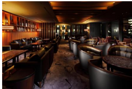
バー店内ホール席