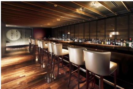
バー店内カウンター席

※ザ・キャピトル バーは1.5次会や二次会の会場としてもご利用いただけます。ご興味がございましたらお気軽にご相談・お問い合わせください ※法令によりお車を運転されるお客さまへのアルコール提供および20歳未満のお客さまの入店(ホール席)をご遠慮いただいております ※カウンター席のみ禁煙となります ※新型コロナウイルス感染症による日本政府および東京都、関係機関の示す方針に準じ、内容に変更が生じる可能性がございます ※写真はイメージです