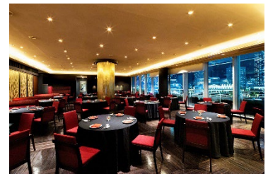
中国料理「スーツァンレストラン陳」内観イメージ

【ご予約・お問い合わせ先】 宿泊予約 Phone: 045-682-2251 (受付時間 9:00～18:00)