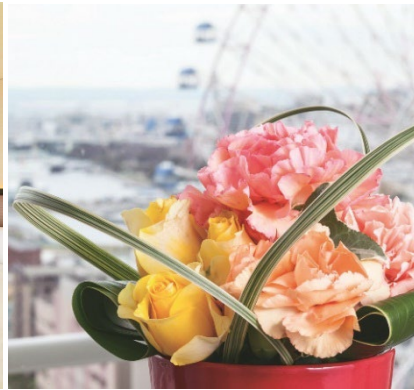
フラワーアレンジメント イメージ