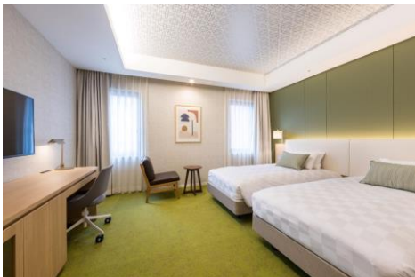
吉祥寺エクセルホテル東急 プレミアムツインルーム1泊朝食付き / 2組4名様

吉祥寺の自然を感じるカラーコーディネートとの室内と、レインシャワーを備えたゆったりとした広さのバスルームが、安らぎのホテルステイを演出します。