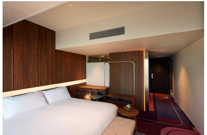
HOTEL GROOVE SHINJUKU 客室(32 m 2 )