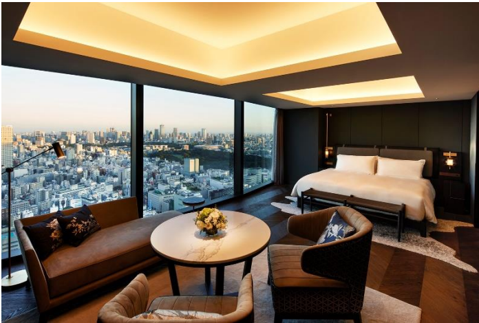
BELLUSTAR TOKYO 客室(53 m 2 )

BELLUSTAR TOKYO, A Pan Pacific Hotel、HOTEL GROOVE SHINJUKU, A PARKROYAL Hotel(東京都新宿区、総支配人 西川克志)は、開業日を2023年5月19日（金）に決定いたしました。また、客室タイプ限定で予約の受付を開始しております。