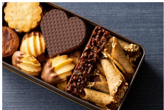
▲ バレンタイン クッキーアソート

サブレ オ ショコラ / ショコラ オ テ / フロランタンカカオ / コルネ / サブレ ポッシュ / ガレットブルトンショコラ