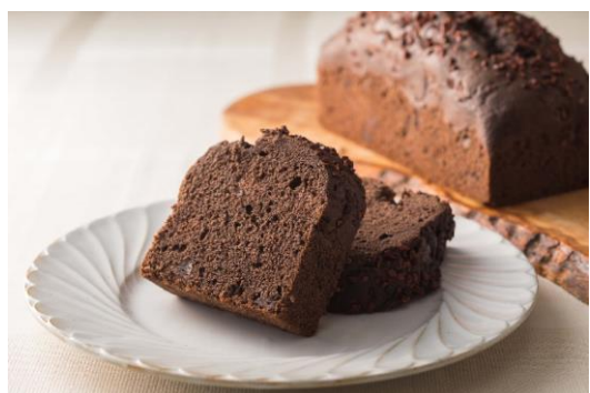
▲ チョコバナナブレッド

1963年の創業以来愛され続けているバナナブレッドをバレンタインの期間限定アレンジでご用意。ローストナッツを思わせる豊かな香ばしさが特長のチョコレートと完熟バナナが奏でるリッチなハーモニーをお楽しみいただけます。