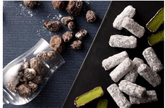
▲ マスカットレーズンショコラ&抹茶ミユスカディーヌ

約1か月間リキュールに付け込んだ国産のマスカットレーズンの瑞々しさと香り広がる抹茶のガナッシュをビターチョコレートの中に閉じ込めました。2種類の味わい異なるチョコレートを一箱に詰めておとどけいたします。チョコレートのガナッシュではなく、本商品はあえて抹茶味にすることで、これまでにない新しさも追及しています。