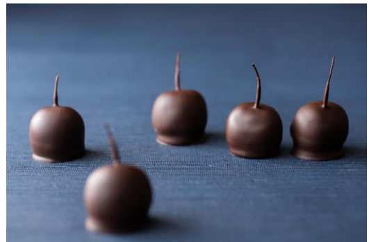
▲ チェリーボンボン

どこか懐かしさを感じさせる味わいのボンボンショコラ。ブランデーに漬けたアメリカンチェリーにフォンダンを纏わせ、ビターチョコレートでコーティング。瑞々しいチェリーの酸味と芳醇なチョコレートをご堪能ください。