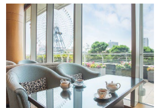
ラウンジ「ソマーハウス」内観

※テイクアウト専用アフタヌーンティーもございます。詳細はお問い合わせください ※社会状況により、変更が生じる場合がございます ※写真はイメージです ※表示料金にはサービス料・税金が含まれております ※食材の入荷状況により、メニューが変更になる場合がございます