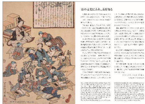
中面イメージ（一例）

THE HOTEL HIGASHIYAMA では、京都ならではの美意識に触れ、滞在の魅力を高めるオリジナル文化体験プログラム「京いろは」を実施し、京都の文化を国内外に発信しております。