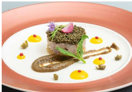
千葉県勝山産シマアジととんぶりのタルタル ケーパーとレーズン風味