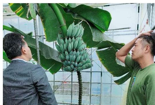
現地視察の様子(きみさらずバナナ)