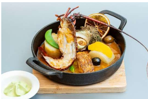
伊勢海老とサザエのフィッシャーマンズスープ仕立て ほうれん草とニンニクのエスプーマ添え