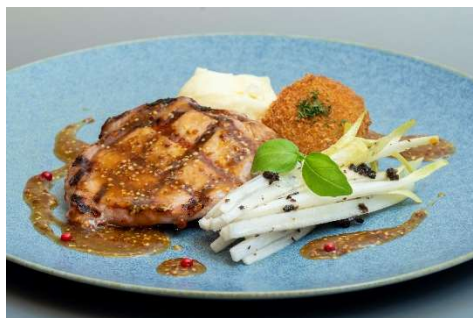
いも豚の網焼きと豚足のパネ アンディーブサラダ添え 粒マスタードソース