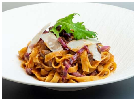
千葉県産せんば牛すね肉と紫キャベツの ラグーソース タリアッテレ

[内容] 千葉県産せんば牛すね肉と紫キャベツのラグーソース タリアッテレ 2,200 円 / 九十九里産いわしのオイルサーディンと茸とブロッコリー 燻製醤油のペペロンチーノ アヒージョ風 2,300 円 / 千葉県産いも豚 Chorizo と季節野菜のトマトスパゲティー 温玉とセルバチコ添え 2,200 円