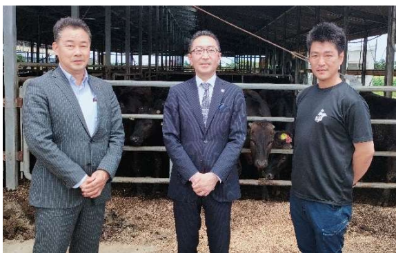
現地視察の様子(せんば牛)

羽田エクセルホテル東急は羽田空港第2ターミナル直結のため、飛行機での出発前や到着後のご利用にも大変便利です。ご家族やご親族、ご友人と、千葉の魅力あふれる「食」をこの機会に是非お楽しみください。