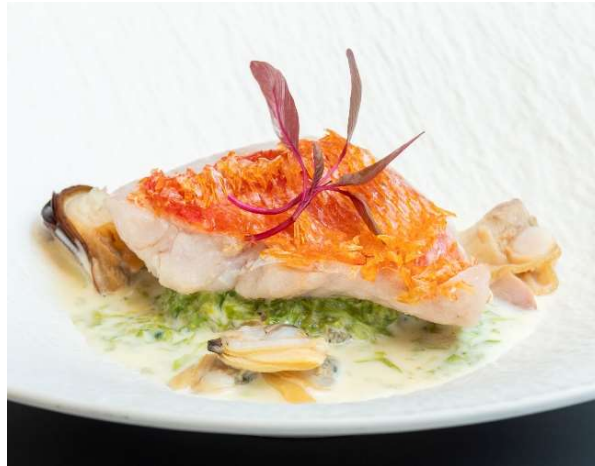
銚子産釣り金目鯛の若狭焼 粒すけのガレット添え 青海苔のナージュ仕立て