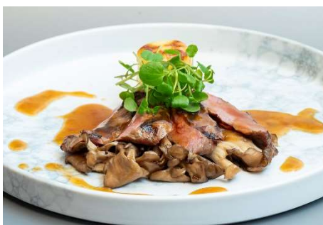
千葉県産せんば牛ロースの網焼き 長生ファームの舞茸とドフィノワーズポテト添え