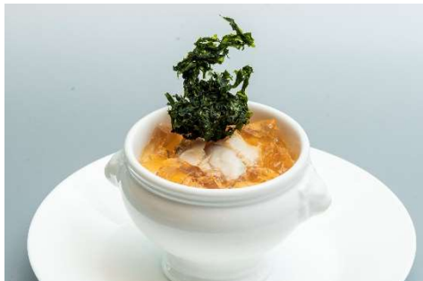
九十九里地はまぐりのロワイヤル 木更津の焼きバラ添え