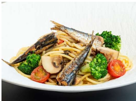
九十九里産いわしのオイルサーディンと 茸とブロッコリー 燻製醤油のペペロンチーノ アヒージョ風