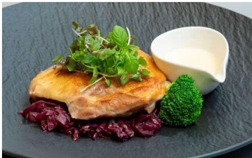
千葉県産錦爽鶏のモモ肉コンフィ 赤キャベツとリンゴのブレゼ ナチュラルなブルーレジュと共に