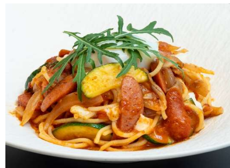
千葉県産いも豚 Chorizo と季節野菜の トマトスパゲティー 温玉とセルバチコ添え