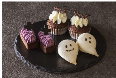
【中段】チョコレートカップケーキ、 チョコタルト 紫芋クリーム、 ゴーストマカロン キャラメルクリーム