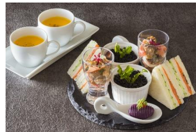
【下段】セイボリー アッシュェパルマンティエソラエ風、 生ハムとキノコのマリネ、紫芋の 揚げニョッキ、スモークサーモンと キューカンバーサンド、 ウェルカムスープ