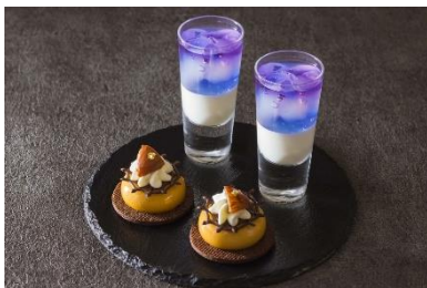
【上段】パンナコッタとバタフライピ ーのジュレ、マロンムース コーヒー 風味