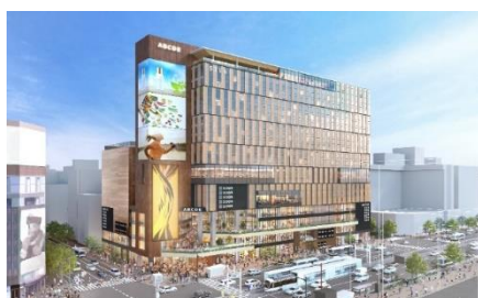
SAPPORO STREAM HOTEL 外観イメージ