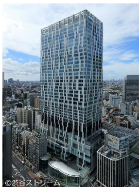
渋谷ストリーム 外観