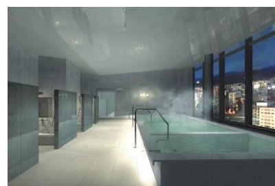
札幌の夜景もご覧いただける温浴施設 イメージ (プレミアムカテゴリーご利用特典)