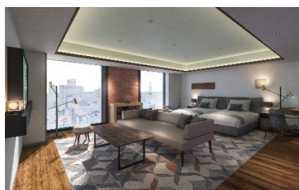
プレミアムコンフォートツイン イメージ