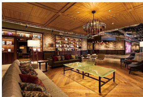
渋谷ストリームエクセルホテル東急 ロビー