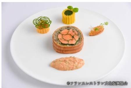
鱈のアンクルート カラスミ風味のクーリビヤック ソースショロン