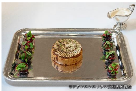
茸のスプレクシユ ソースシュブレーム

セルリアンタワー東急ホテルは、今後も様々なコンクールへのチャレンジを通して料理技術やサービスレベルの向上と継承に努め、お客様により一層ご満足いただけるホテルを体現してまいります。