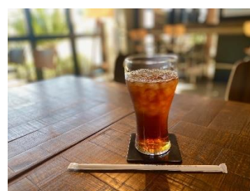
カフェでのコースター利用イメージ