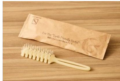
Green Planet のヘアブラシ