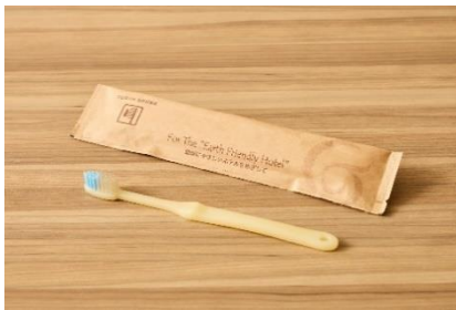
Green Planet の歯ブラシ