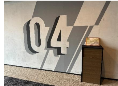
回収ボックス設置イメージ

東急ホテルズ&リゾートは、ホテル事業を通じて「持続可能な社会」の実現に貢献するべく、2019 年に【サステナブル方針】を制定し、「地球にやさしいホテル・まちにやさしいホテル・ひとにやさしいホテル」という 3 つのサステナビリティ（目指す姿）と 6 つのサステナブル重要テーマ（社会課題の中から重点的に取り組んでいくテーマ）を定め、SDGs（持続可能な開発目標）の観点を深く認識しながら、ホテル事業を通じて「持続可能な社会」の実現に貢献してまいります。