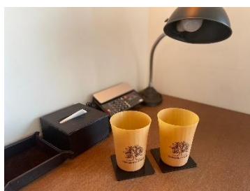
客室でのコースター利用イメージ