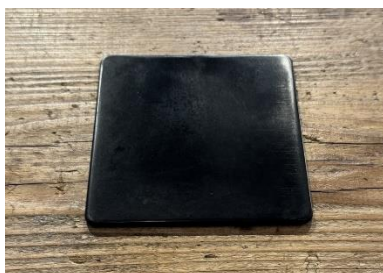
アップサイクルしたコースター

本年9月に発表した新大阪江坂東急 REI ホテルの靴べらに続き、第2弾として、川崎キングスカイフロント東急 REI ホテルでお客様が使用した Green Planet の歯ブラシとヘアブラシからコースターにアップサイクルし、客室および「The WAREHOUSE BUSINESS LOUNGE & CAFÉ」（1階）に設置します。