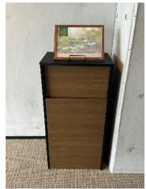
Green Planet アメニティ回収ボックス

本取り組みを実施するにあたり、同ホテルでは使用済みの Green Planet 専用の回収ボックスを用意しました。通常のプラスチックなど Green Planet 以外の素材が混ざると、純粋な Green Planet のアップサイクルが出来ないためです。お客様のチェックアウト後、清掃係が Green Planet のアメニティのみを専用回収ボックスへ投入します。お客様にもこのアップサイクル事業をお伝えし、ご協力いただける際にはご自身で投入いただくことも可能です。専用回収ボックスは客室フロアのエレベーターホール、4 階・5 階からスタートし、その後順次設置階数を増やしていきます。