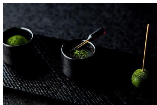
南山園 お濃茶づくし