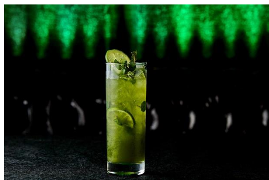
抹茶モヒート（モクテル）