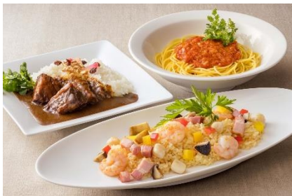
Jo-ji ライトミールイメージ

※食物アレルギーのある方は、予めスタッフにお知らせください ※食材の入荷状況により、メニューが変更になる場合がございます