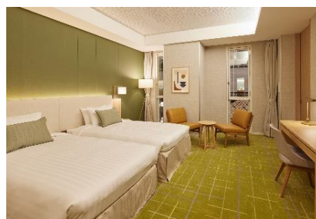
プレミアムタイプ客室（一例）