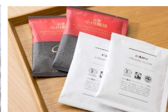
プレミアムタイプ客室内アメニティイメージ