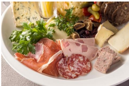
シャルキュトリー盛り合わせイメージ