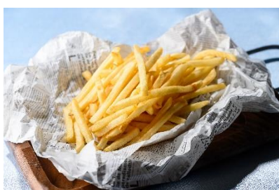
フライドポテト トリュフソルト風味