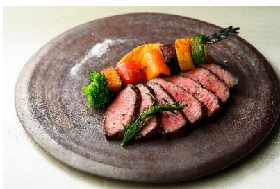
鹿児島県産黒牛のロースト ジャポネソース