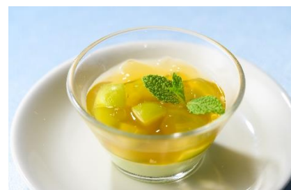
マスカットのジュレとパンナコッタ