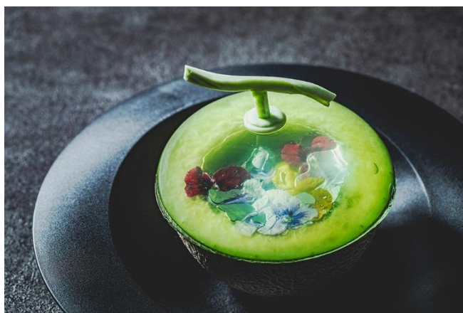
メロン半玉のフルーツポンチはお1人さま1皿ずつご用意

https://www.tokyuhotels.co.jp/sapporostream/restaurant/splash_cafe/afternoon-tea-jewel-box/index.html