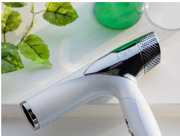
▲リファ ビューテックドライヤースマートダブル