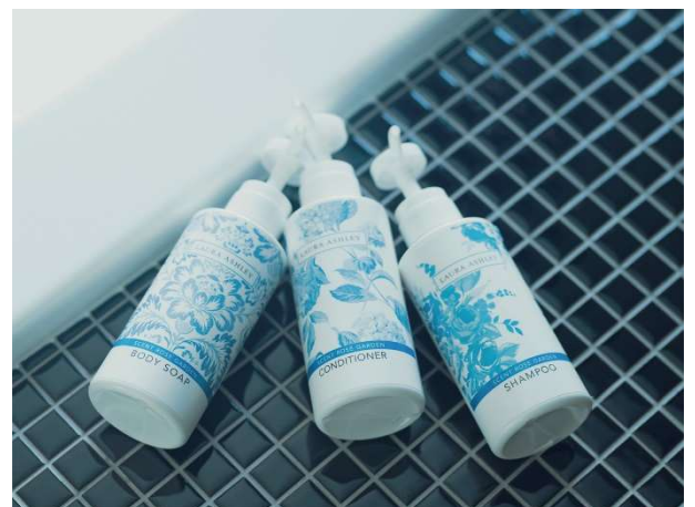
▲ローラアシュレイのバスアメニティ