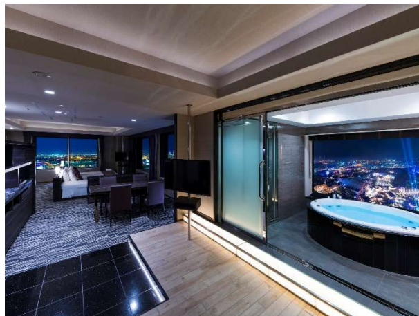
▲ザ・パーク・フロントルーム