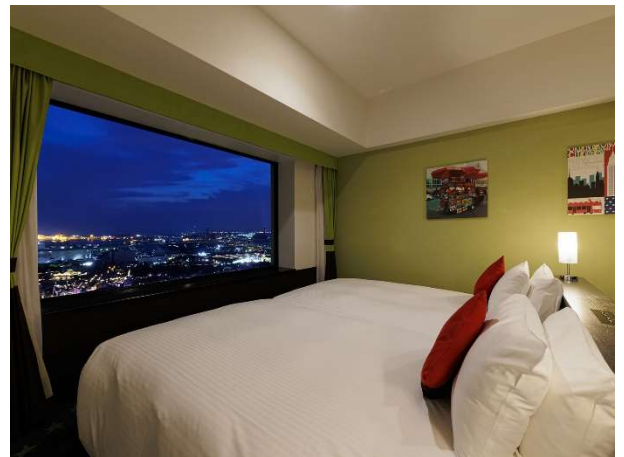
▲パークビューファミリールーム(一例)

リファ ビューテックドライヤースマートダブルをご用意。 またローラアシュレイのバスアメニティをご用意しました。