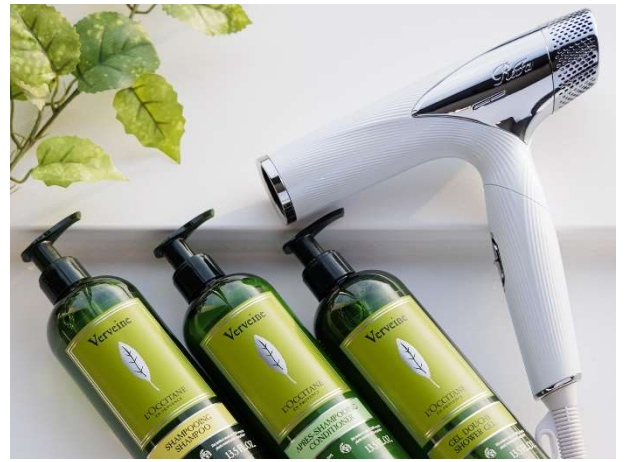
▲『ラグジュアリーフロア』アメニティ(イメージ)