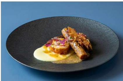
青森シャモロックのロティエー ガランティエヌ仕立て 青森県産牛蒡のフライ添え