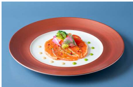
青い森紅サーモンのマリネ 八角とコリアンダー風味 ディジョンマスタードのピネグレット