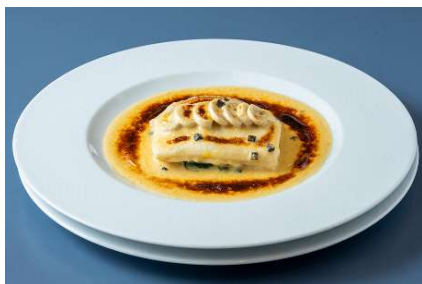
龍飛岬マツカワガレイのソースボンファントリュフ風味