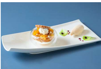
はつ恋ぐりんとフロマーージュブランのヴェリーヌ タタン風 シナモンのアイスと共に