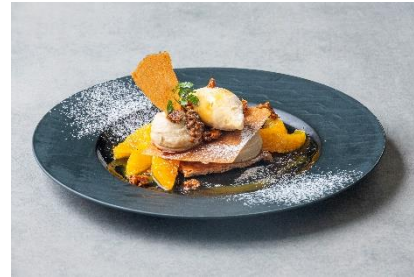
【北薩摩産「大将季（だいまさき）」と 紅茶のミルフィーユ風】