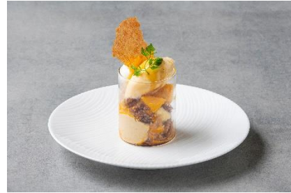
【プレートセットのデザート】