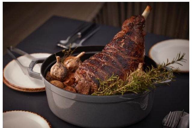
400℃で旨味を閉じ込めた骨付き仔羊モモ肉の石窯ロースト