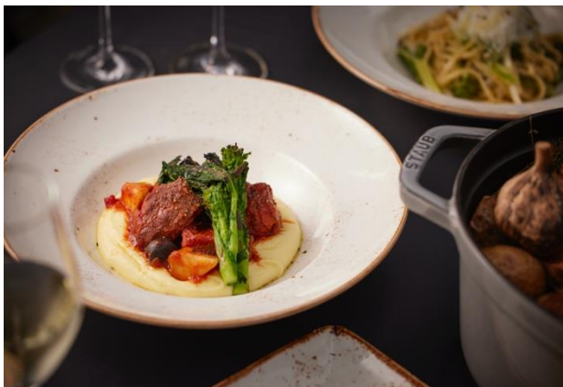
仔羊腿肉と黒オリーブのトマト煮込み なめらかなポテトピューレ