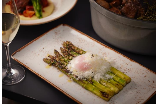
アスパラガスの石窯グリルとペコリーノ・ロマーノと温度卵