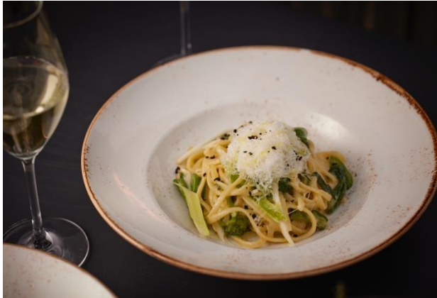
春野菜とペコリーノ・ロマーノのパスタ カチョエペペ

ビール、スパークリングワイン、ワイン、ハイボール、カクテル 10種、ノンアルコール 10種