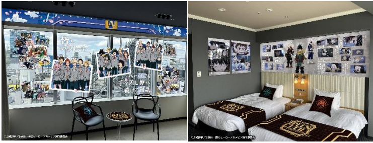
▲雄英高校 1 年 A 組ルーム