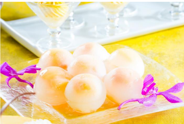
透き通る氷に包まれた「白桃の氷菓」

そのほかにも、「白桃の氷菓」や「レモンジュレ」、フレッシュな「スイカ」など、暑い季節に嬉しい爽やかな夏果実も取り揃え、心地よくお楽しみいただける内容といたしました。