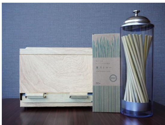
博多エクセルホテル東急 草ストローリユース

これらの取り組みに加え、各施設における日常的な運営やサービスを通じた活動も含め、総合的に評価された結果、今回の認証取得に至りました。