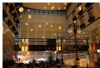
ランタンリリースセレモニー

※法令によりお車を運転される方、20歳未満のお客様へのアルコールの提供は一切お断りいたします ※写真はイメージです