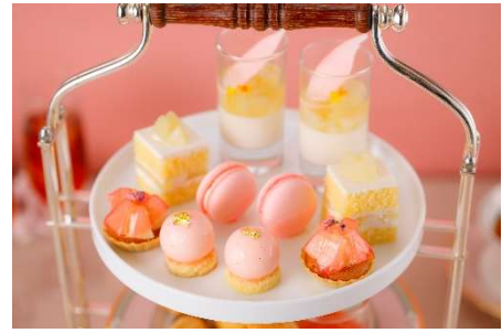
■ 1段目 スイーツ