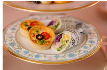
■ 3段目 セイボリー