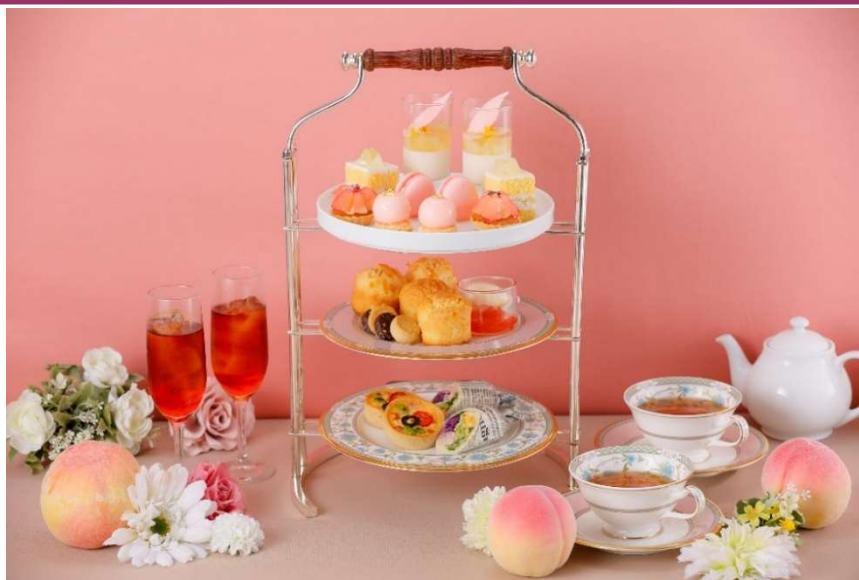
アフタヌーンティーセット～ピーチ～

名古屋の夏を桃の香りとともに。甘くとろける旬の桃スイーツが彩る 期間限定アフタヌーンティー、名古屋東急ホテルで開催！