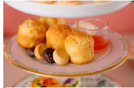
■ 2段目 ベイクドスイーツ