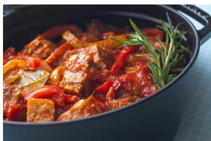
牛肉とパプリカのピペラード風煮込み

お子さまから大人まで、みんなで楽しめる「トスカフェスティバル」はまさに“トスカの夏祭り”です。開放感のある高い吹き抜けにパームツリーが立ち並び、リゾート感あふれる空間「カフェ トスカ」で、夏のひとときをお過ごしください。