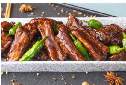
低温調理のスペアリブ 五香粉と黒酢のソース