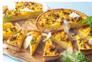
コーンと枝豆のカレー風味のキッシュ