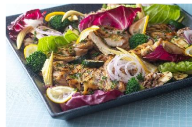
塩麴でマリネして焼き上げたハーブチキン