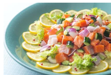
サーモンとレッドオニオンのロミロミ風サラダ

※食材の入荷状況により、メニューが変更になる場合がございます ※表示料金はサービス料・税金が含まれております ※写真はイメージです