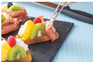
ふじさわ生豚とフレッシュフルーツのフレンチトースト