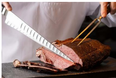
ジューシーに焼き上げたローストビーフ