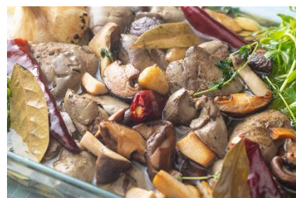
鶏レバーと茸の冷製アヒージョ風