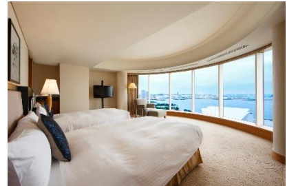
グランドコーナースイート ベイビュー 客室