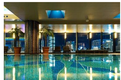
ナイトプール イメージ