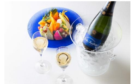
シャンパン&フルーツ盛り合わせ イメージ