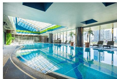
Blue Oasis 内観(昼)イメージ