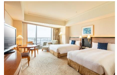
エグゼクティブツイン ベイビュー