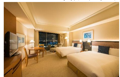
エグゼクティブツイン ベイビュー