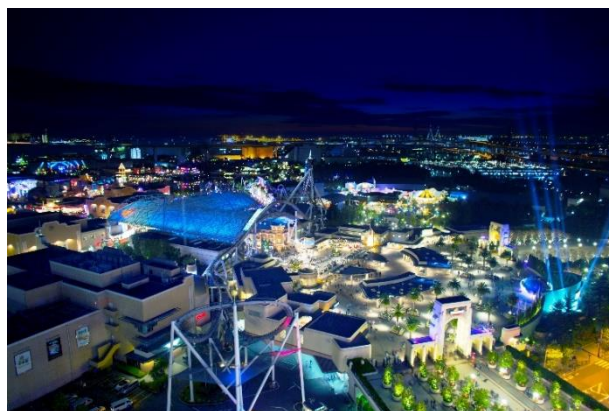
パークビュールームからの眺めは絶景。