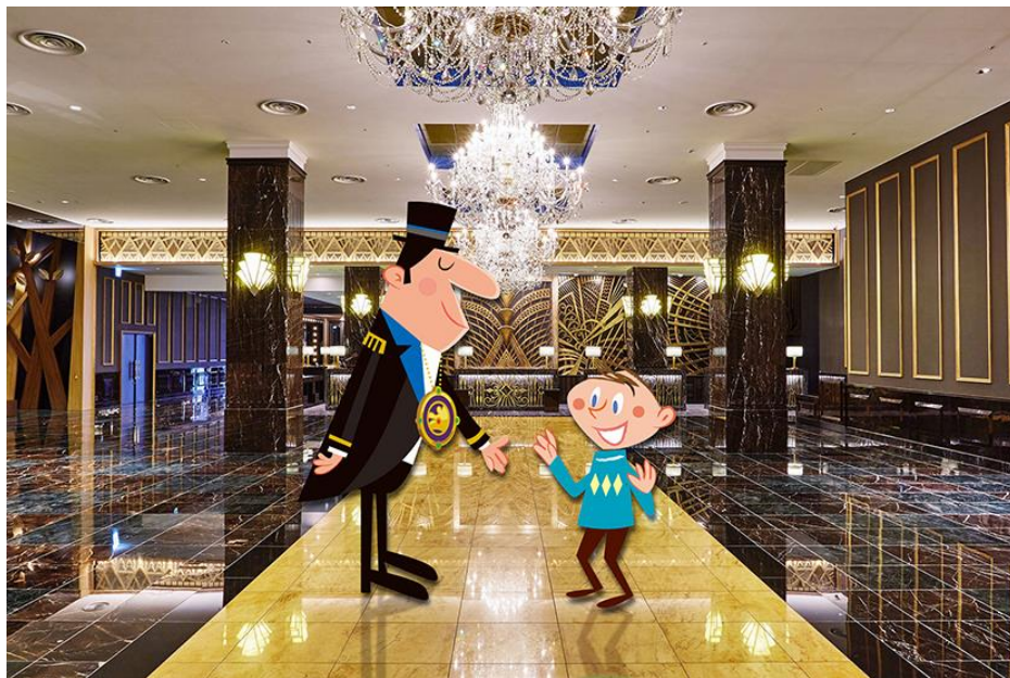
タイムトラベルの世界を楽しく演出する タイムトラベル・コンシェルジュ。

パーク開業 15 周年を記念して、特別な宿泊プランもご用意いたしました。ぜひこの機会に、何度来ても飽きない、子供も大人も笑顔いっぱいのホテルステイをお楽しみください。