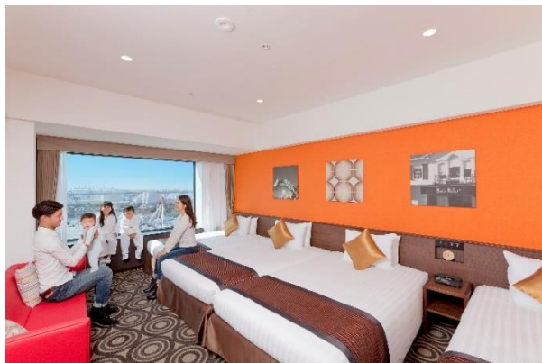
ファミリーでもゆったりくつろげるパークビュールーム。

パークで大人気のスヌーピーと兄弟たちがデザインされたとってもかわいいオリジナルバッグをプレゼント。幅 37cm・高さ 34cm・マチが 9cm の大きなバックには、楽しい旅の思い出とともにパークのおみやげをたくさん詰めてお持ち帰りいただけます。