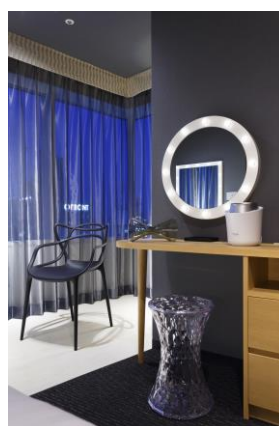
ドレッサーは LED 付の女優ミラー。家具もオシャレに。