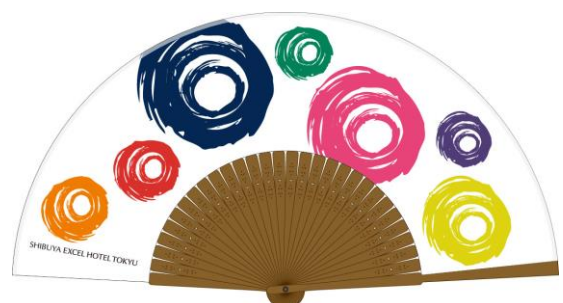
ホテルオリジナル扇子イメージ