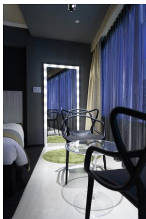
スポットライトを浴びて LED 付鏡の前に立てばモデル気分！

そこで、本年 5 月 29 日～8 月 19 日にかけて行う客室改装計画の中で、このようなニーズに特化した客室をコンセプトルームとして作ることになり、今回の改装フロアである 7 階～12 階のうち 10～12 階の角部屋（計 3 室）が他の客室と比べて大幅リニューアルを遂げることとなりました。