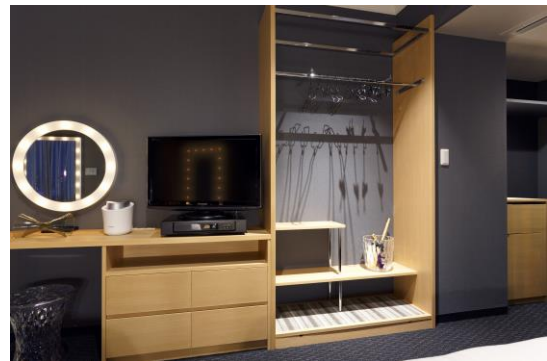
クローゼットには扉を付けず“見せる収納”に。

部屋の名称に使用している「MODE(モード)」はフランス語・英語で「流行・ファッション」という意味を持ち、「非日常的な・非凡な」などの意味で使われることもあるそうです。