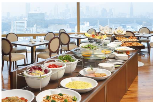
レストラン「アピエント」朝食ビュッフェ

http://www.shibuya-e.tokyuhotels.co.jp/ja/stay/plan/1416118572695.html